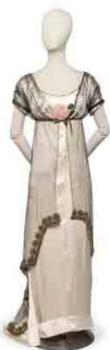
Paul Poiret — Robe du soir Joséphine, 1907

À travers 550 œuvres, l'exposition met en lumière l'influence durable de Paul Poiret et révèle l'étendue de son génie créatif. Chronologique et thématique, l'exposition plonge le visiteur dans le Paris moderne du premier quart du XXe siècle. Elle met en lumière les débuts du parcours de Paul Poiret, retraçant les bases de son apprentissage chez Doucet et Worth. On découvre au fil de la déambulation les multiples facettes du créateur dont la pratique s'apparente plus à celle d'un chef d'orchestre que d'un simple couturier. Le parcours est ponctué d'œuvres d'artistes ayant accompagné Poiret tout au long de sa carrière.