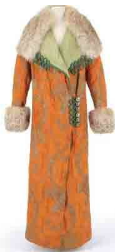
Paul Poiret — Manteau du soir Paris, vers 1910

Le prix, à régler sur place auprès d'Alain Wilbois, est de 30 € pour a conférence, toujours avec nos fidèles conférencières.